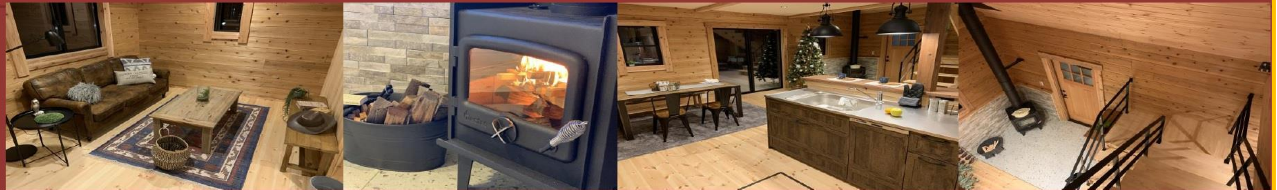
多目的用途で使える半個室コーナーでリラックス 本物の温かみを感じられる薪ストーブ 約40㎡の広々としたリビング・ダイニング 開放感のある吹抜け、家族との絆も深まります