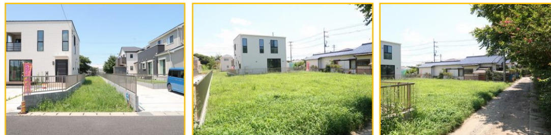
☆現地写真 陽当り良好です