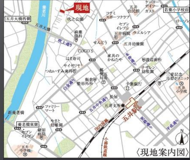
カーナビ:市原市五井2193番1付近

【物件概要】 ■所在地/市原市五井字外光海津2193番1の一部 ■構造規模/在来工法2階建 ■土地権利/所有権 ■地目/宅地 ■都市計画/市街化区域 ■用途地域/第一種住居地域 ■建ぺい率/60% ■容積率/200% ■公法制限/第1種高度地区、22条区域、日影規制(4h-2.5h-4m)、景観法 ■築年月/2020年2月上旬予定 ■現況/建築中 ■引渡日/2020年2月中旬予定 ■接道状況/西側4.13m公道、南側5m私道 ■設備/公営水道・公共下水・都市ガス・東京電力 ※図面と現況が異なる場合は現況を優先させていただきます。