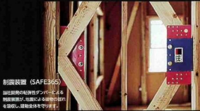
制震装置 (SAFE365) 当社開発の粘弾性ダンパーによる制震装置が、地震による建物の揺れを吸収し、建物全体を守ります。

地震の揺れに耐える「耐震性能」と、揺れを抑えて住宅へのダメージを軽減する「制震性能」を兼ね備えた建築住宅ブランド「QUIE」。ふたつの備えで、お客様の家を守ります。