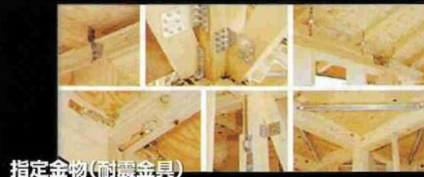
指定金物(耐震金具)

木造住宅の接合部の強度を高めるため、要所に性能認定金物を使用し、耐震性を高める工夫を行っております。耐震接合金物を使用すると、建物にかかる応力を有効に伝達するので、安定した強固な構造体となり、安心して暮らせる住まいが実現できます。また、構造用合板を構造材に直接留め付ける剛床工法は、たわみを減少させ、床鳴り防止と耐震性をアップします。