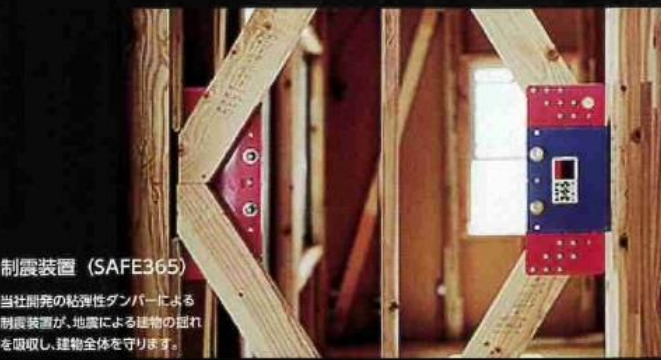
制震装置 (SAFE365) 当社開発の粘弾性ダンパーによる制震装置が、地震による建物の揺れを吸収し、建物全体を守ります。

地震の揺れに耐える「耐震性能」と、揺れを抑えて住宅へのダメージを軽減する「制震性能」を兼ね備えた建築住宅ブランド「QUIE」。ふたつの備えで、お客様の家を守ります。