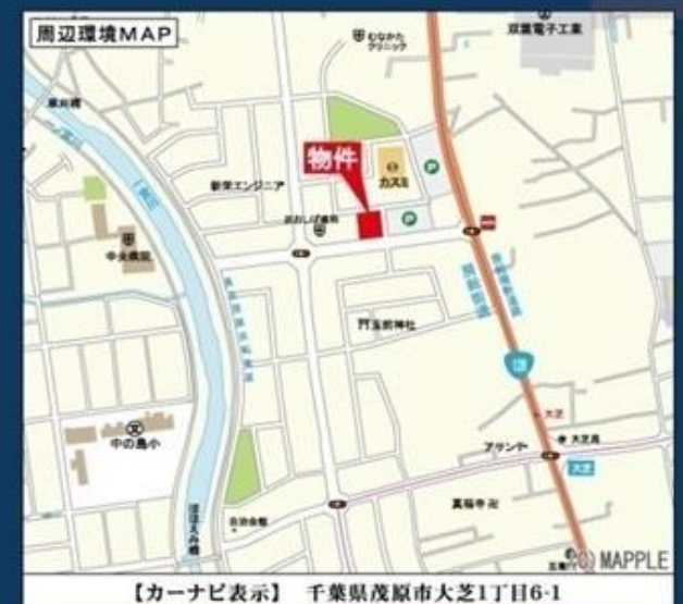
【カーナビ表示】千葉県茂原市大芝1丁目6-1