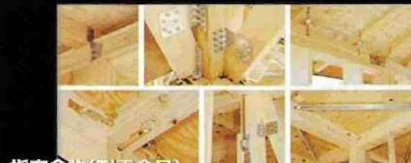
指定金物(耐震金具)

構造材を大きく傷つける「通し柱」を見直し、シンプルに接合し金物で補強して強度を高める工法を採用しました。 柱はJIS規格の集成材を工場でプレカットしていますので精度が高く、現場での作業も簡単に品質が安定しています。 様々な研究と実証実験を行い、より科学的で合理的な新工法を採用し家づくりの革新に取り組み続けています